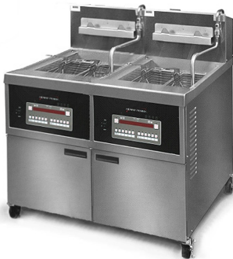
Friggitrice aperta ad alta capacità con due vasche a sollevamento automatico, modello OFA-342

MODELLO OFE-342 2 vasche elettrica OFG-342 2 vasche a gas